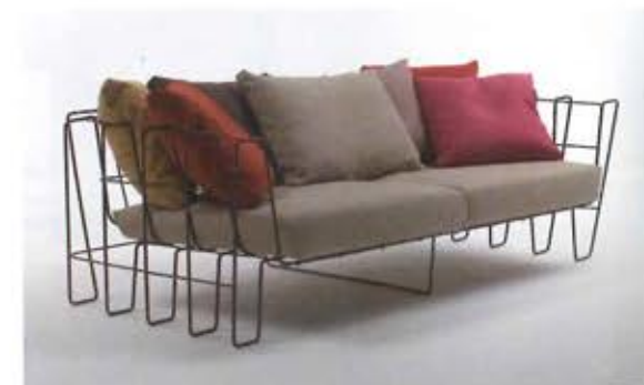
Premierowy pokaz kanapy „Hoop” zaprojektowanej przez Arika Levy'ego dla włoskiej marki Living Divani odbył się podczas Milan Design Week w 2009 r.

Arik Levy to artysta, projektant, fotograf i reżyser. Urodził się w 1963 r. w TelAwiwie. Do Europy przeniósł się w 1988 r., a 3 lata później ukończył z wyróżnieniem Wzornictwo Przemysłowe na Art Center Europe w Szwajcarii. Po odbyciu stażu w Japonii, podczas którego koncentrował się głównie na produktach i obiektach przeznaczonych na wystawy, Levy powrócił do Europy i poświęcił się tworzeniu scenografii do oper i spektakli muzycznych. Zakładając wła-