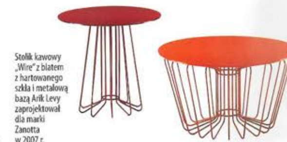
Stolik kawowy „Wire” z blatem z hartowanego szkła i metalową bazą Arik Levy zaprojektował dla marki Zanotta w 2007 r.