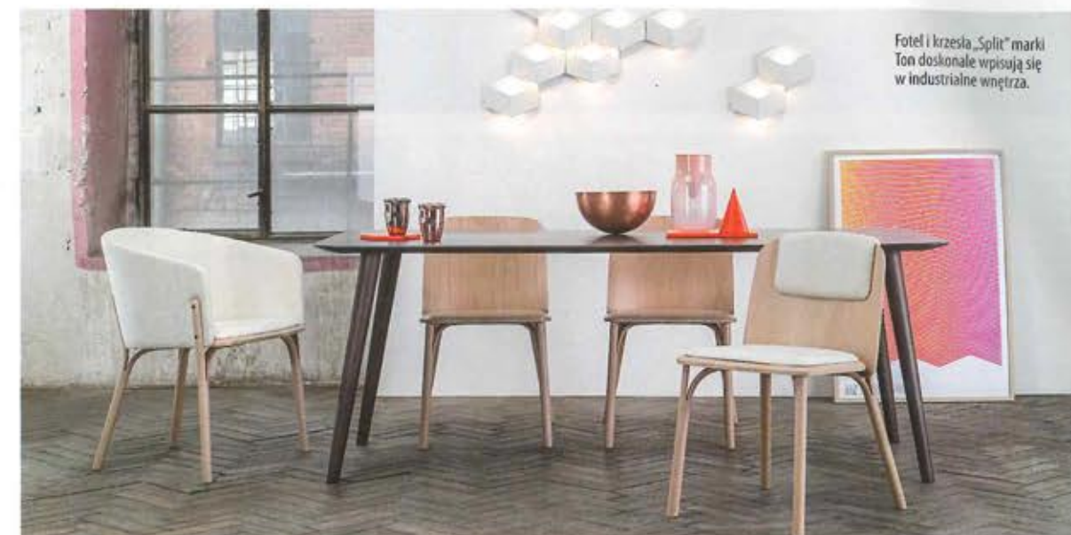
Fotel i krzesła „Split” marki Ton doskonale wpisują się w industrialne wnętrza.

W swoich twórczych poszukiwaniach Arik Levy kieruje się dewizą zawartą w słowach, które sam kiedyś wypowiedział: Myszę, że tak naprawdę świat jest o ludziach, a nie o obiektach. Projektujemy dla ludzi. Jego drugie motto to: Żadnych kompromisów. Oba przesłania zdają się być równie ważne i nie potrzebują dodatkowych wyjaśnień, tak jak pewne zachowania projektanta, które są na tyle wymowne, że nie wymagają komentarzy. Gdy pewnego razu Arik Levy zgodził się na nietypową formę wywiadu, właściwie zabawę polegającą na udzielaniu odpowiedzi na pytania za pomocą rysunków i miał w ten sposób przedstawić siebie – narysował serce. A gdy musiał opisać siebie używając tylko jednego słowa napisał: JA.